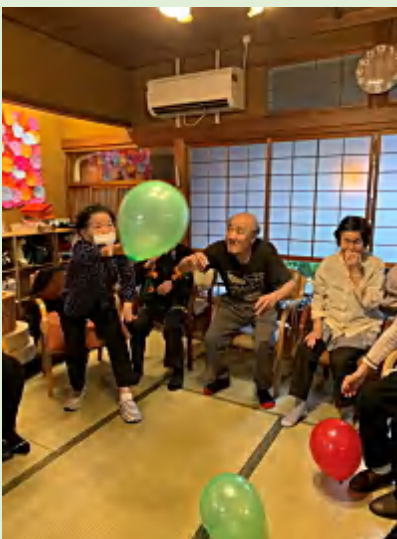
風船バレーで200回達成