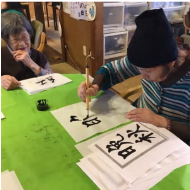
こうぼう筆をえらばず。 久しぶりの習字は気分良いね。