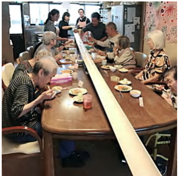
全長8mの本格的な流しそうめん。 勢いよく流れてきた麺をキャッチ。