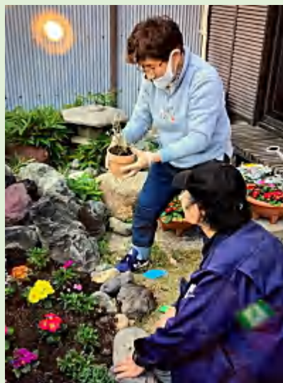
食べれるものを育てよう